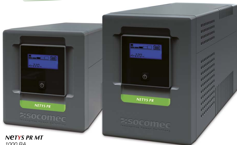
NETYS PR MT 1000 ВА