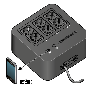
NETYS 150 B