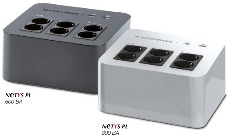
NETYS PL 600 ВА