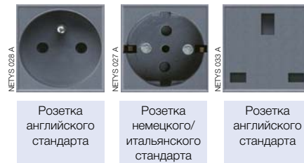
Розетка английского стандарта